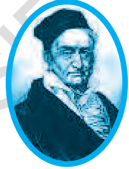
कार्ल फ्रैड्रिक गॉस (1777 – 1855)

अंकगणित की आधारभूत प्रमेय के रूप में विख्यात होने से पहले, प्रमेय 1.2 का संभवतया सर्वप्रथम वर्णन यूक्लिड के एलीमेंट्स की पुस्तक IX में साध्य (proposition) 14 के रूप में हुआ था। परंतु इसकी सबसे पहले सही उपपत्ति कार्ल फ्रैड्रिक गॉस (Carl Friedrich Gauss) ने अपनी कृति डिसक्वीशंस अरिथिमेटिकी (Disquisitiones Arithmeticae) में दी। कार्ल फ्रैड्रिक गॉस को प्रायः 'गणितज्ञों का राजकुमार' कहा जाता है तथा उनका नाम सभी समयकालों के तीन महानतम गणितज्ञों में लिया जाता है, जिनमें आर्किमिडीज़ (Archimedes) और न्यूटन (Newton) भी सम्मिलित हैं। उनका गणित और विज्ञान दोनों में मौलिक योगदान है।