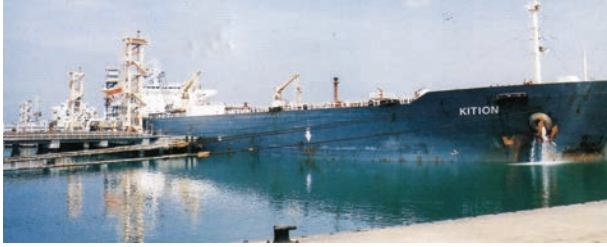
चित्र 7.7 – न्यू-मंगलौर पत्तन पर टैंकर द्वारा कच्चे तेल का निर्वहन

पत्तन की सुविधा भी प्रदान कर सके। लौह-अयस्क के निर्यात के संदर्भ में मारमागाओ पत्तन देश का महत्वपूर्ण पत्तन है। यहाँ से देश के कुल निर्यात का आधा (50 प्रतिशत) लौह-अयस्क निर्यात किया जाता है। कर्नाटक में स्थित न्यू-मैंगलोर पत्तन कुद्रेमुख खानों से निकले लौह-अयस्क का निर्यात करता है। सुदूर दक्षिण-पश्चिम में कोची पत्तन है; यह एक लैगून के मुहाने पर स्थित एक प्राकृतिक पोताश्रय है।