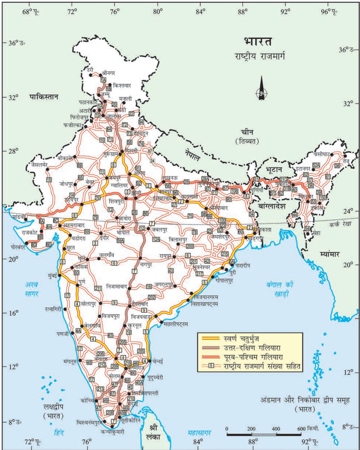
भारत - राष्ट्रीय राजमार्ग