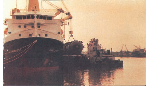
चित्र 7.8 – बड़े आकार के कार्गो को उठाने-रखने की सुविधाओं से युक्त तूतीकोरन पत्तन

पूर्वी तट के साथ तमिलनाडु में दक्षिण-पूर्वी छोर पर तूतीकोरन पत्तन है। यह एक प्राकृतिक पोताश्रय है तथा इसकी पृष्ठभूमि भी अत्यंत समृद्ध है। अतः यह पत्तन हमारे पड़ोसी देशों जैसे – श्रीलंका, मालदीव आदि तथा भारत के तटीय क्षेत्रों की भिन्न वस्तुओं के व्यापार को संचालित करता है। चेन्नई हमारे देश का प्राचीनतम कृत्रिम पत्तन है। व्यापार की मात्रा तथा लदे सामान के संदर्भ में इसका मुंबई के बाद दूसरा स्थान है। विशाखापट्टनम स्थल से घिरा, गहरा व सुरक्षित पत्तन है। प्रारम्भ में यह पत्तन लौह-अयस्क निर्यातक के रूप में विकसित किया गया था। ओडिशा में स्थित पारादीप पत्तन विशेषतः लौह-अयस्क का निर्यात करता है। कोलकाता एक अंतःस्थलीय नदीय (Riverine) पत्तन है। यह पत्तन गंगा-ब्रह्मपुत्र बेसिन के वृहत् व समृद्ध पृष्ठभूमि को सेवाएँ प्रदान करता है। ज्वारीय (Tidal) पत्तन होने के कारण तथा हुगली के तलछट जमाव से इसे नियमित रूप से साफ करना पड़ता है। कोलकाता पत्तन पर बढ़ते व्यापार को कम करने हेतु हल्दिया सहायक पत्तन के रूप में विकसित किया गया है।