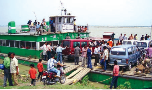
चित्र 7.5 – उत्तर-पूर्वी राज्यों में आंतरिक जलमार्ग परिवहन अधिक महत्वपूर्ण है

भारत के लोग प्राचीनकाल से समुद्री यात्राएँ करते रहे हैं। इसके नाविकों ने दूर तथा पास के क्षेत्रों में भारतीय संस्कृति व व्यापार को फैलाया है। जल परिवहन, परिवहन का सबसे सस्ता साधन है। यह भारी व स्थूलकाय वस्तुएँ ढोने में अनुकूल है। यह परिवहन साधनों में ऊर्जा सक्षम तथा पर्यावरण अनुकूल हैं। भारत में अंतः स्थलीय नौसंचालन जलमार्ग 14,500 किमी. लंबा है। इसमें केवल 5,685 किमी. मार्ग ही मशीनीकृत नौकाओं द्वारा तय किया जाता है।