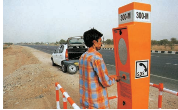
चित्र 7.10 – राष्ट्रीय राजमार्ग-8 पर एक आपातकालीन कॉल बॉक्स

डिजिटल भारत एक ज्ञान आधारित परिवर्तन के लिए, भारत को तैयार करने के लिए एक विशाल कार्यक्रम है। डिजिटल भारत कार्यक्रम का मुख्य उद्देश्य IT (भारतीय प्रतिभा) +IT (सूचना प्रौद्योगिकी)=IT (कल का भारत) में होने वाले परिवर्तन को समझना है और तकनीक को केन्द्र में रखकर बदलाव लाना है।