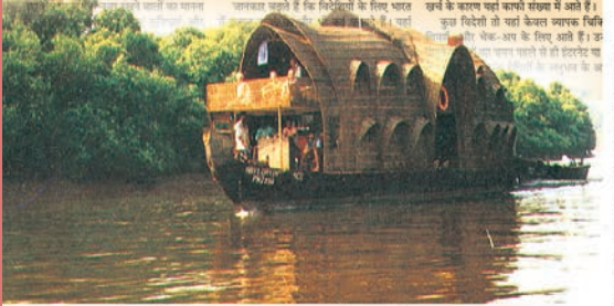
गोआ के मैंग्रोव वन में पारि-पर्यटन

का अनुमान किया होटलों के साथ कर रहे हैं और केरल और महाराष्ट्र जैसे पर्यटन के विकास में अग्रणी राज्यों पर अन्य छोटी मकानों का अग्र महत्व तीन वर्ष पहले तक भारत में इतना बंधा हुआ था। यही नहीं, अस्पतालों की संख्या केवल प्रतिशत भी जबकि आज यह संख्या 10 प्रतिशत तक पहुंच चुकी है। यहां अपने पहले लोगों को चिकित्सा संस्था भारतीय, इंग्लिश, अरबी, फ्रेंच और हिन्दी के लोगों को सुनते हैं। यह एक विशाल लाभ है कि यहां प्रत्येक अस्पताल में चिकित्सा के विभागों को यहां के विदेशी चिकित्सा सुविधाओं और खर्च के कारण यहां काफी संख्या में आते हैं।