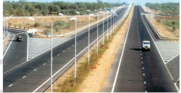
चित्र 7.1 – अहमदाबाद-वडोदरा द्रुतमार्ग