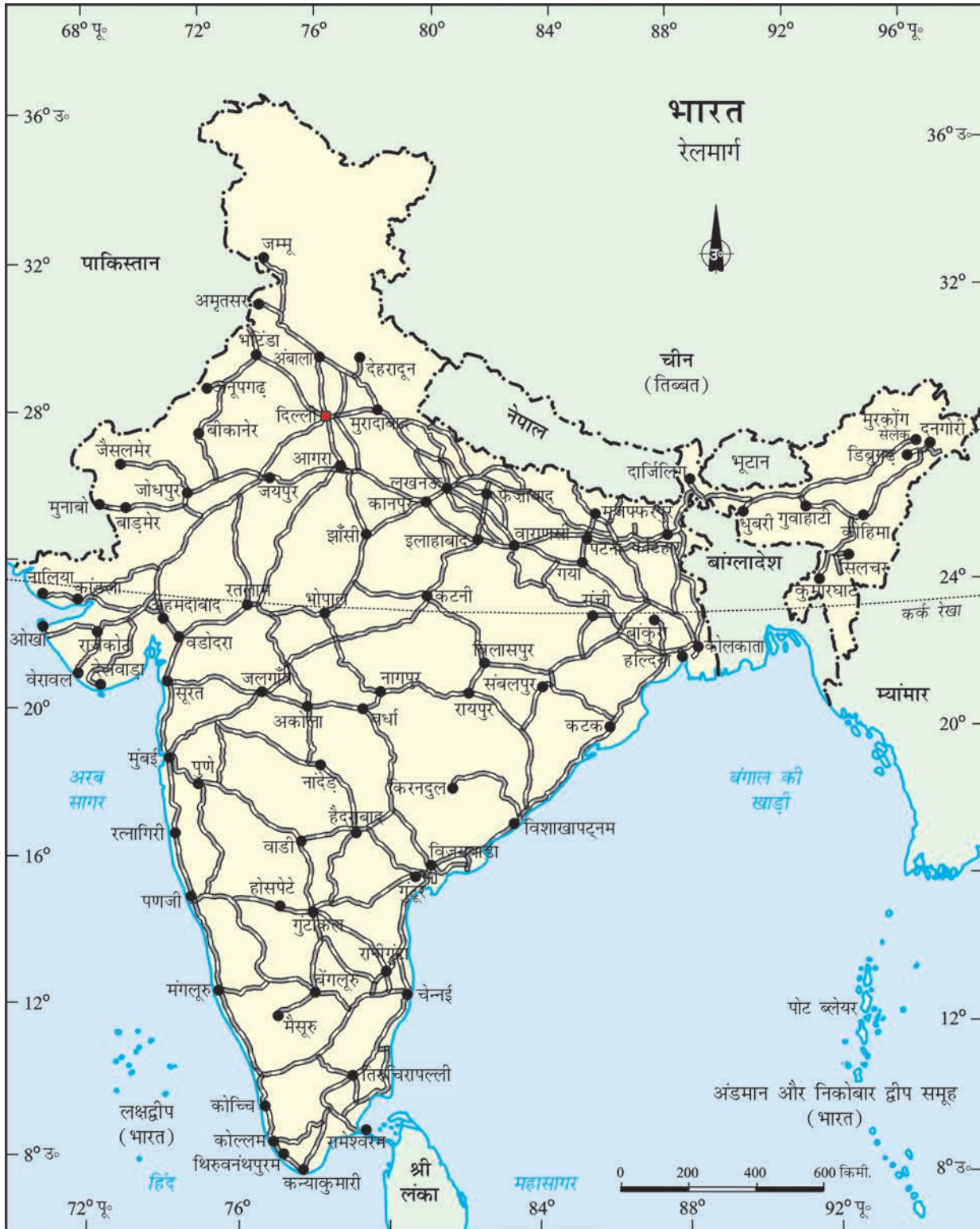
भारत - रेलमार्ग

क्या आप जानते हैं? रेलवे लाइन कश्मीर घाटी में बनिहाल से बारामुला तक बिछाई जा चुकी है। इन दोनों शहरों को भारत के मानचित्र पर चिह्नित करें।