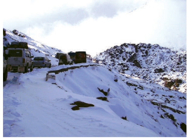
चित्र 7.4 – उतरी-पूर्वी सीमा सड़क पर यातायात (अरुणाचल प्रदेश)