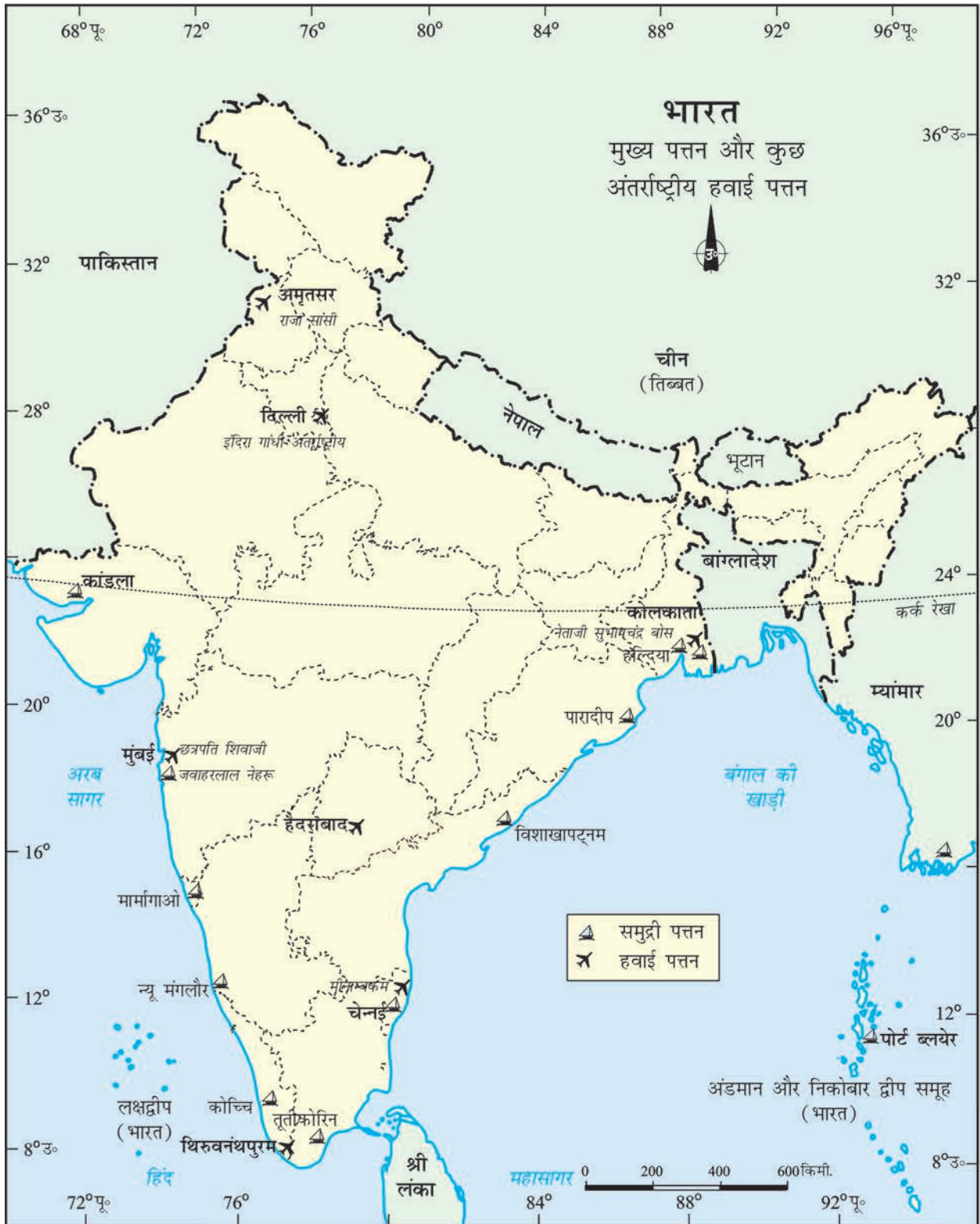
भारत - मुख्य पत्तन और कुछ अंतर्राष्ट्रीय हवाई पत्तन