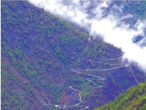
चित्र 7.3 – पहाड़ी रास्ते