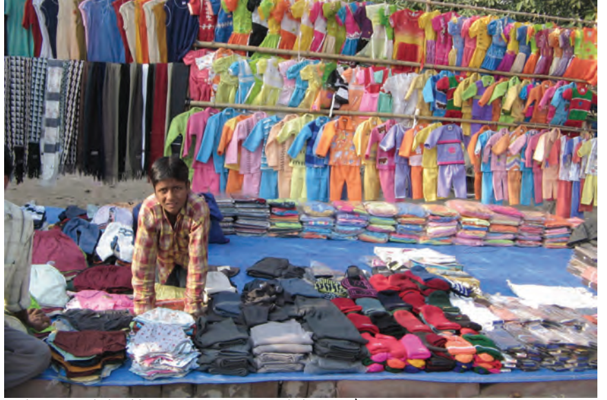
सिलेसिलिए वस्त्रों के छोटे व्यापारी बहुराष्ट्रीय कंपनियों के ब्रांड और आयात दोनों से कड़ी प्रतिस्पर्धा का सामना करते हुए।

सामान्यतः व्यापार के खुलने से वस्तुओं का एक बाज़ार से दूसरे बाज़ार में आवागमन होता है। बाज़ार में वस्तुओं के विकल्प बढ़ जाते हैं। दो बाज़ारों में एक ही वस्तु का मूल्य एक समान होने लगता है। अब दो देशों के उत्पादक एक दूसरे से हजारों मील दूर होकर भी एक दूसरे से प्रतिस्पर्धा कर सकते हैं। इस प्रकार, विदेश व्यापार विभिन्न देशों के बाज़ारों को जोड़ने या एकीकरण में सहायक होता है।