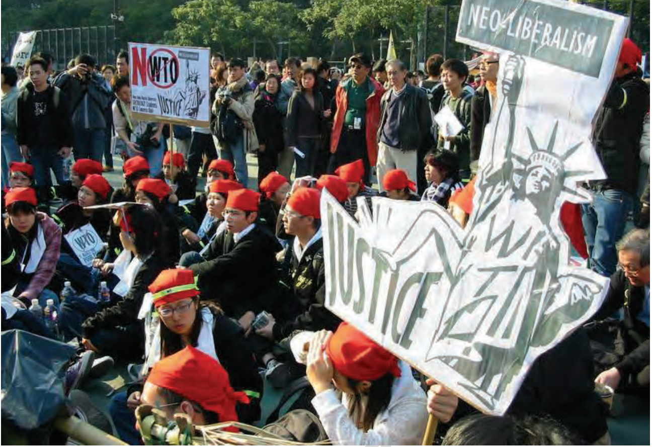
हांगकांग में डब्लू.टी.ओ. के खिलाफ प्रदर्शन-2005