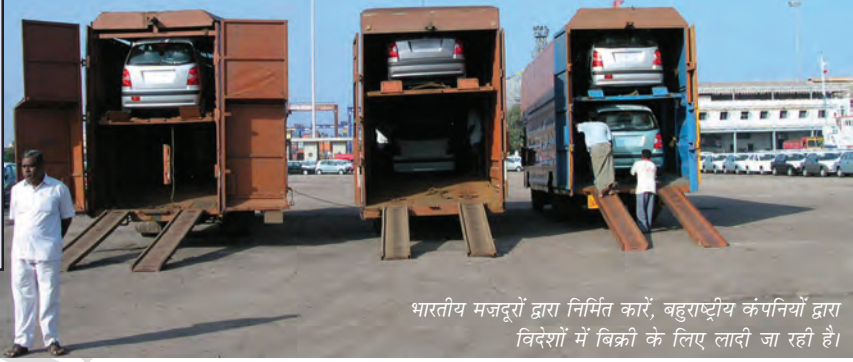
भारतीय मजदूरों द्वारा निर्मित कारें, बहुराष्ट्रीय कंपनियों द्वारा विदेशों में विक्री के लिए लादी जा रही हैं।