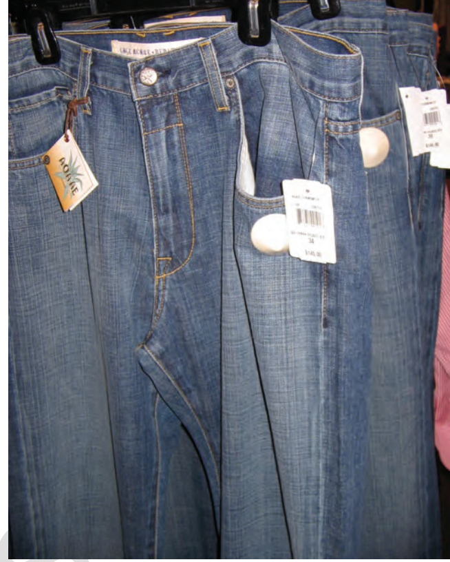
विकासशील देशों में उत्पादित जीन्स अमेरिका में 6500 रु. में बेची जा रही है।

छोटे उत्पादकों द्वारा उत्पादन किया जाता है। बहुराष्ट्रीय कंपनियों को इन उत्पादों की आपूर्ति की जाती है। फिर इन्हें अपने ब्राण्ड नाम से ग्राहकों को बेचती हैं। इन बड़ी कंपनियों में दूरस्थ उत्पादकों के मूल्य, गुणवत्ता, आपूर्ति और श्रम-शतों का निर्धारण करने की प्रचण्ड क्षमता होती है।