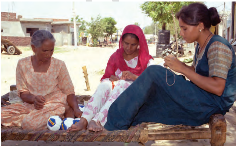
लुधियाना के एक घर में एक बड़ी बहुराष्ट्रीय कंपनी के लिए फुटबाल-निर्माण का चित्र

बहुराष्ट्रीय कंपनियाँ एक अन्य तरीके से उत्पादन नियंत्रित करती हैं। विकसित देशों की बड़ी बहुराष्ट्रीय कंपनियाँ छोटे उत्पादकों को उत्पादन का ऑर्डर देती हैं। वस्त्र, जूते-चप्पल एवं खेल के सामान जैसे उद्योग हैं, जहाँ विश्वभर में बड़ी संख्या में