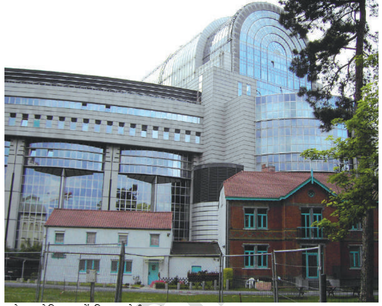
ब्रूसेल्स, बेल्जियम में स्थित यूरोपीय संसद

आपको बेल्जियम का मॉडल कुछ जटिल लग सकता है। निश्चित रूप से यह जटिल है—खुद बेल्जियम में रहने वालों के लिए भी। पर यह व्यवस्था बेहद सफल रही है। इससे मुल्क में गृहयुद्ध की आशंकाओं पर विराम लग गया है वरना गृहयुद्ध की स्थिति में बेल्जियम भाषा के आधार पर दो टुकड़ों में बँट गया होता। जब अनेक यूरोपीय देशों ने साथ मिलकर यूरोपीय संघ बनाने का