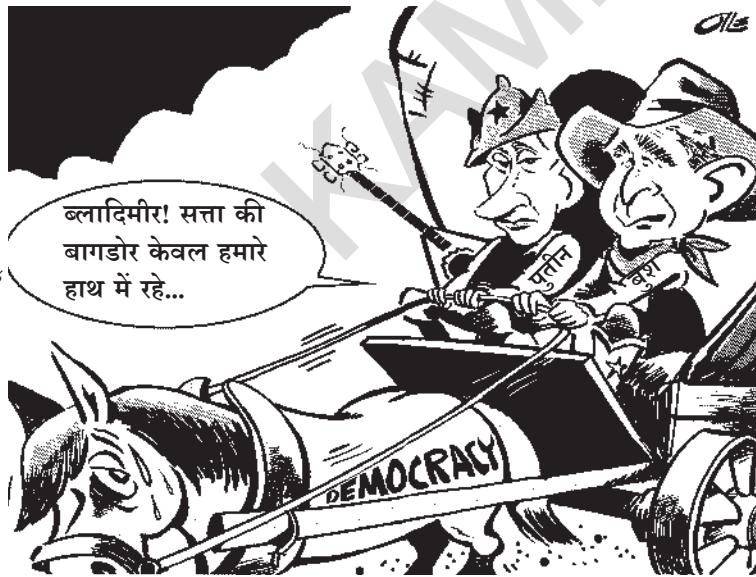
सत्ता की बागडोर

2005 में रूस में कुछ नए कानून बने हैं। इन कानूनों को बनाकर रूस के राष्ट्रपति को कुछ और शक्तियाँ सौंपी गई हैं। इसी वक्त अमरीकी राष्ट्रपति ने रूस का दौरा किया था। ऊपर दिए गए कार्टून के अनुसार लोकतंत्र और सत्ता के केंद्रीकरण में क्या संबंध है? यहाँ जिस चीज़ की तरफ़ ध्यान खींचा गया है उसकी पुष्टि में क्या आप कुछ और कार्टून जुटा सकते हैं?